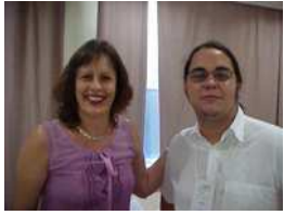
mvv - 01bn