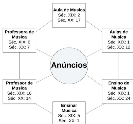
Imagem 1: Quantitativo dos dados localizados entre os séculos XIX e XX, e respectivas palavras-chave.

Os resultados quantitativos obtidos a partir dessas buscas estão resumidos na imagem a seguir.