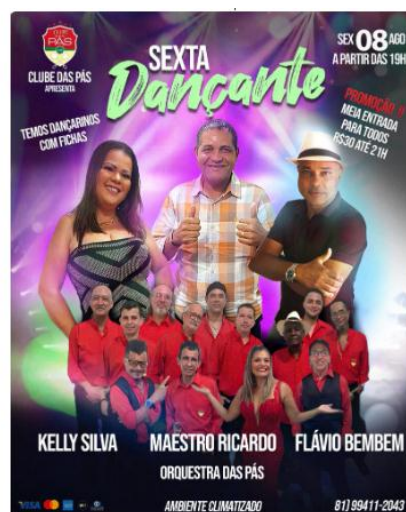
Imagem 2 - Clube das Pás.

Na zona norte da cidade, localizado na rua Odorico Mendes 263, Recife, o Clube das Pás, fundado em 1888, fora gestado como espaço destinado ao frevo. Sua criação ocorreu dois meses antes da Abolição da Escravatura no Brasil quando um grupo de foliões, depois de abastecer um navio cargueiro de carvão, no período carnavalesco, botou as pás nas costas para comemorar no Clube dos Caiadores, e em meio aos festejos do período, surgia o nome Bloco das Pás de Carvão. Iris Costa (2025) refere um reconhecimento social do Clube das Pás como o clube de frevo mais antigo do estado de Pernambuco, considerado em tempos atuais como um dos principais representantes da vida cultural de Recife.