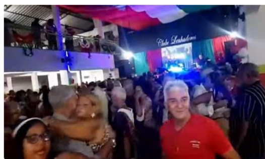
Imagem 3 - Clube Lenhadores, 2024

Seguindo essa categoria de reconhecimento social de espaços de dança e entretenimento nos cotidianos da cidade, foi fundado em 5 de Março de 1897, no bairro do Recife Antigo, o Clube Carnavalesco Misto Lenhadores. Sua história é marcada pelo reconhecimento do clube como patrimônio do Recife pela lei