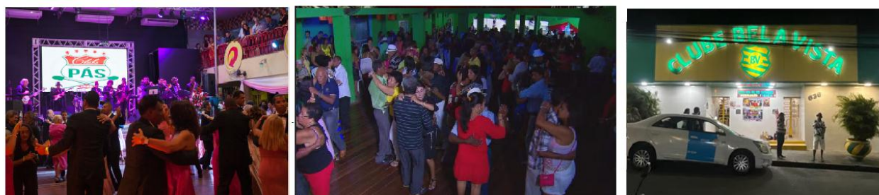
Imagem 1 - O Clube das Pás, Clube Lenhadores, Clube Bela Vista

Era comum uma certa comparação presente entre os conceitos e perspectivas dos melhores espaços de música caribenha. Clubes, bares e casas de dança locais correspondia e legitimava um gosto popular por estilos expressivos do caribe, constituindo fama aos principais bairros da cidade, para além de projetar o nome da capital pernambucana como exemplo fiel do ‘caribe estendido’.