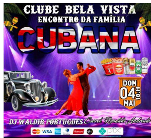
Imagem 4 - Clube Bela Vista - Encontro da Família Cubana.

predomínio da música local e caribenha, é o Clube Assistencial Esportivo Bela Vista (O Clube Bela Vista), localizado na Av. Aníbal Benévolo 636, no bairro de Beberibe, no Recife. Considerado uma das mais tradicionais casas de dança da cidade, foi fundado em 24 de outubro de 1980, representando um exemplo mais recente do hábito musical local que integra como sua marca a música caribenha e local. O clube mantém como plano de sua programação musical a dança de salão e contextos de festa como o Recordando o Passado, na qual enfatiza a cena do brega. Contudo, a programação mais famosa do