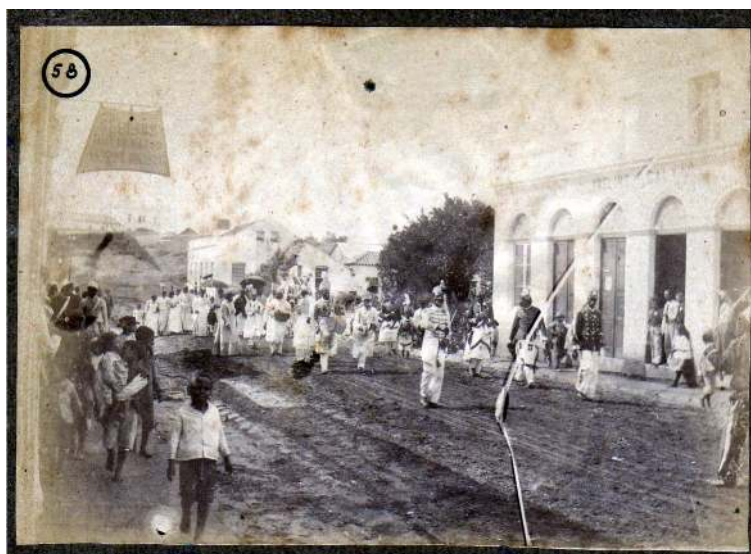
Desfile dos Quicumbis pela Rua Sete de Setembro de Cachoeira do Sul. Acervo do Museu Municipal Edyr Lima, sem autor, sem data (circa 1900). (In: Prass, 2009, p. 77).

Quando desenvolvia minha pesquisa de doutorado, cheguei a algumas descrições sobre o Quicumbi de Cachoeira do Sul e a uma foto (Prass, 2009).